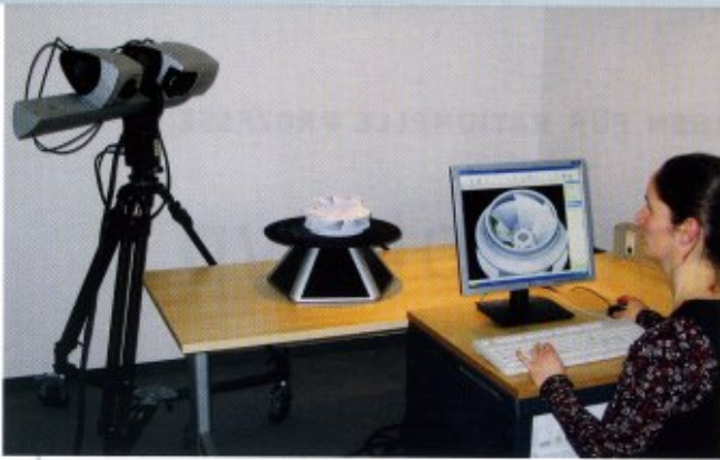
High-End-Projektionsscanner: Diese erstellen beim 3D-Digitalisieren im Kundenauftrag präzise Datensätze für das Reverse Engineering und die Vermessung – und sind hier gerade im Einsatz beim Scannen eines Pumpenlaufrads und der Frontansicht eines Automodells.